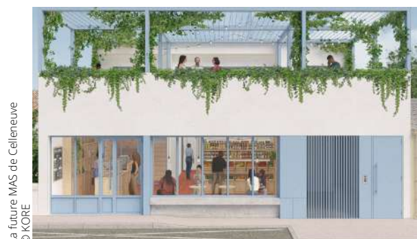
La future MAS de Celleneuve