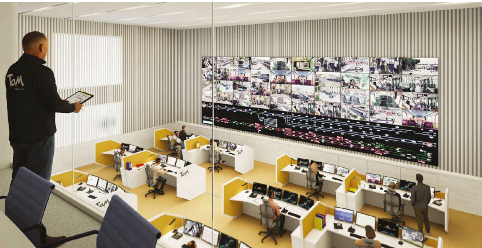
Régulation du TaM - Crédit photo : Groupe 6 Architectes et Archi Graphi