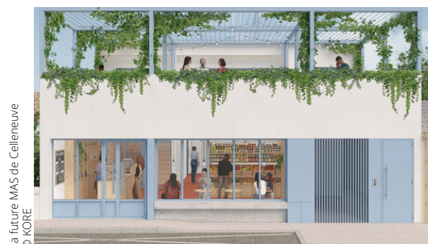
La future MAS de Celleneuve